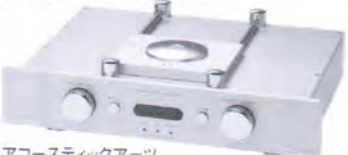
アコースティックアーツ DRIVE II ¥1,430,000

●再生可能ディスク:CD ●デジタル出力:3系統(RCA同軸、BNC同軸、AES/EBU XLRバランス) ●寸法/重量:W482×H130×D375mm/18kg ●備考:リモコン、スタビライザー付属