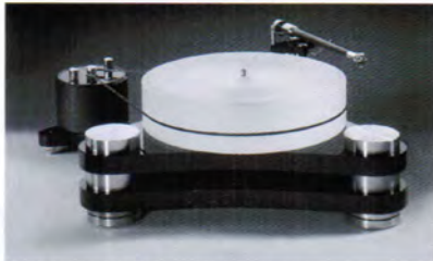
DasLaufwerk 1 アームレス