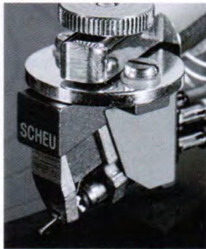
MC SCHEU RUBY 3 MC カートリッジ