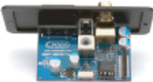
AMB II FM /AMチューナーモジュール ¥29,000(税別)

このプラグインジュールでは、最初に、RF信号をデジタル化し、次に、デジタル領域にて信号を管理、出力信号は、アナログのステレオ信号に解読され、プリ部へ直接に供給され、Evolution 50Aが、レシーバーへと変わる。